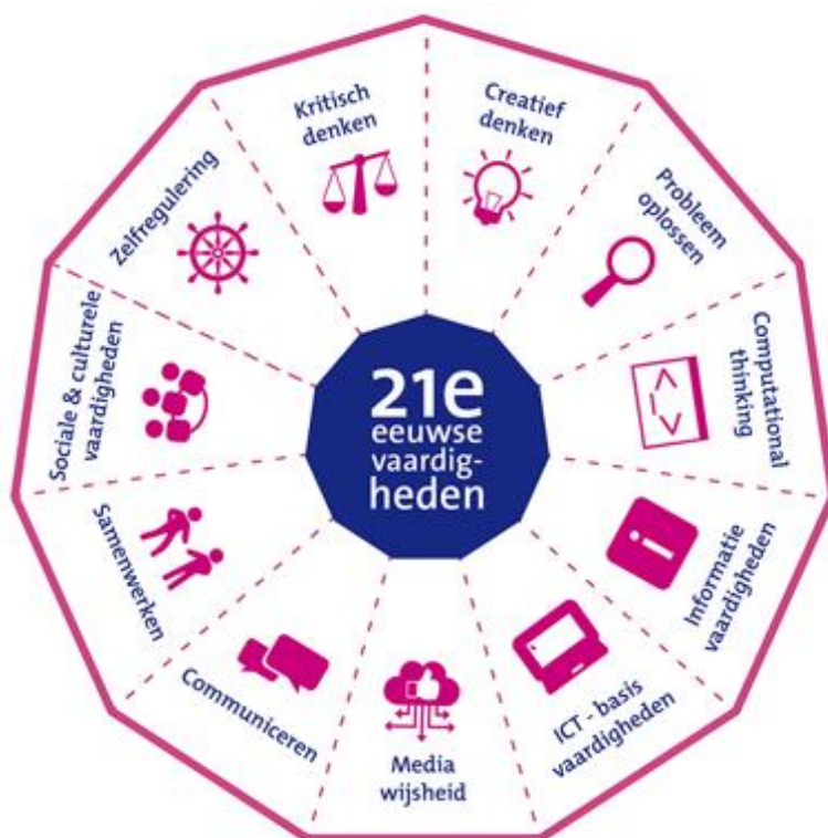
Figuur 2: Het model voor 21 e eeuwse vaardigheden (21st century skills) zoals het is ontwikkeld door SLO en Kennisnet. Geraadpleegd via: https://www.kennisnet.nl/artikel/6648/alles-wat-u-moet-weten-over-21e-eeuwse-vaardigheden/

Het model voor 21 e eeuwse vaardigheden (zie Figuur 2) laat zien dat sociaal-emotionele competentie óók in de toekomst van groot belang is. Communiceren, samenwerken, sociale en culturele vaardigheden, zelfregulering, kritisch denken, creatief denken en probleem oplossen zijn vaardigheden die binnen ons pedagogisch kader belangrijk gevonden en geleerd worden.